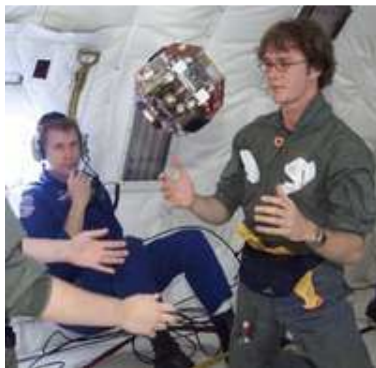
Studenti del MIT che collaudano un prototipo del robot SPHERES

Tre SPHERES in volo libero lavorano insieme all'interno della Stazione Spaziale. Sono indipendenti, ciascuna con la propria energia, i loro propulsori, i computer e i sistemi di navigazione. I risultati ottenuti con questi SPHERES sono importanti per la manutenzione, l'assemblaggio di satelliti, lo studio delle manovre di attracco (docking) e il volo di formazione.