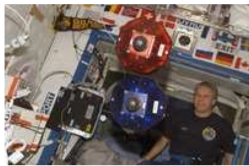
L'astronauta Thomas Reiter con gli SPHERES