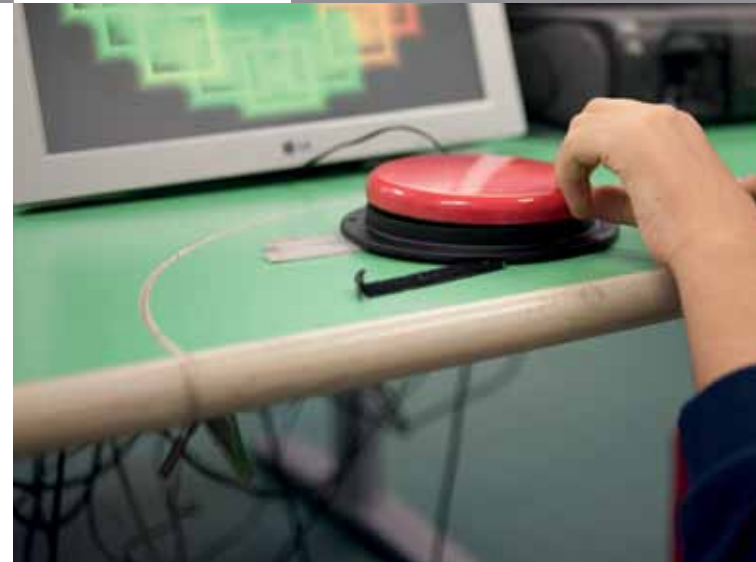
studioconti.biz_2014 / Foto ©Nicolas Tarantino