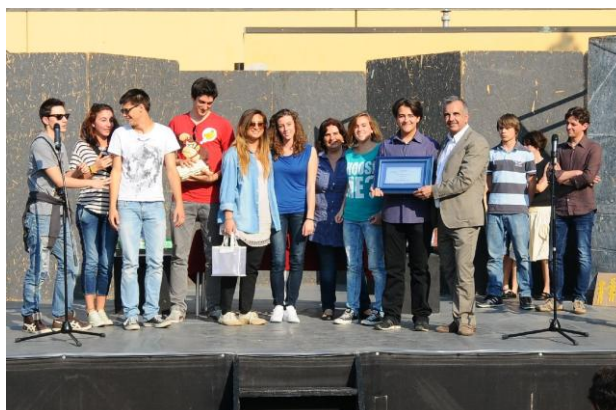
I vincitori dell'edizione 2012: Liceo "Giordano Bruno" di Budrio (BO)

Per partecipare è sufficiente, dopo aver letto il bando di concorso, compilare e firmare il modulo di iscrizione e la scheda di partecipazione allegati e inviarli con le modalità e nei tempi indicati.