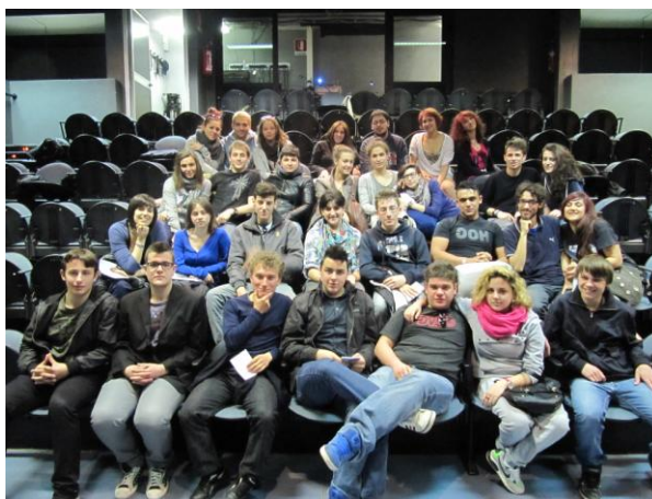
Festival 2012: la Giuria di Ragazzi

Nel 1995 , diciotto anni fa, nasceva la piccola rassegna dei saggi di fine anno dei laboratori del Teatro dell'Argine nelle scuole; piccola rassegna che negli anni crebbe a tal punto da convincerci, nel 2001 , a dar vita a un vero e proprio Festival, aperto a tutti. Dal 2001 sono passati tredici anni .