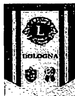
Bologna Benvenuto Suriano